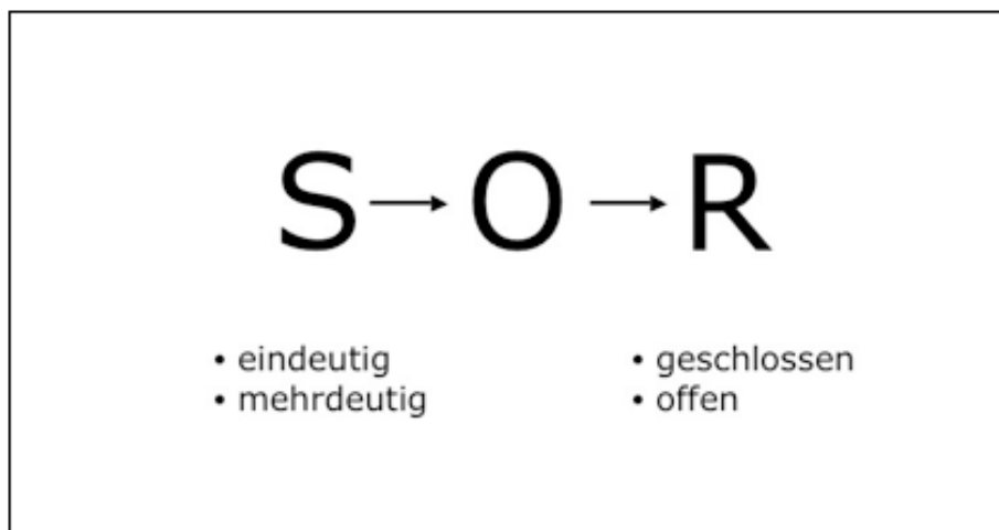
Abbildung 3: Stimulus-Response-Kombinationen

In der Arbeits- und Organisationspsychologie sowie in der Differentiellen und Persönlichkeitspsychologie gibt es seit Jahrzehnten eine dominante Tendenz zu einer „respondenten“ Psychologie. Gern hält man die Stimuli (Fragen in Fragebögen, aber auch oft Fragen in Interviews, Aufgaben in Leistungstests etc.) eindeutig und die Reaktionen geschlossen (Multiple Choice oder abgestufte Skalen = „respondent“) – aus lauter Angst, man könnte sonst nicht mehr genau messen. Es wäre aber ein großer Fortschritt, wenn wir in Verhaltenssimulationen sowie in Interviews vermehrt und im Testbereich überhaupt (erst wieder) mehrdeutige Stimuli und offene (= „operante“) Reaktionen zuließen (vgl. Abb. 3). Man kann dann in einem qualitativ viel breiteren Spektrum diagnostische Informationen einholen: Statt bevorzugt S_{\text{eindeutig}} - R_{\text{geschlossen}} sollte man auch die Kombinationen S_{\text{eindeutig}} - R_{\text{offen}} , S_{\text{mehrdeutig}} - R_{\text{geschlossen}} und S_{\text{mehrdeutig}} - R_{\text{offen}} realisieren.